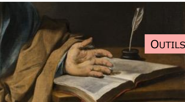
OUTILS ET MÉTHODOLOGIE