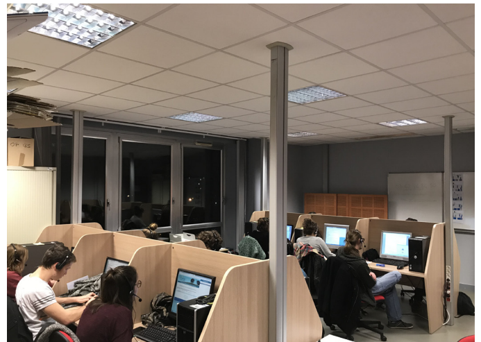
Photo : Plateforme téléphonique ODiF

Une vingtaine d'étudiants vacataires ont été recrutés pour enquêter les diplômés par téléphone. L'ODiF s'est doté pour cela d'une plateforme téléphonique adaptée pour répondre efficacement aux nouveaux besoins du service et aux contraintes liées au périmètre et à la taille de l'Université de Lille.