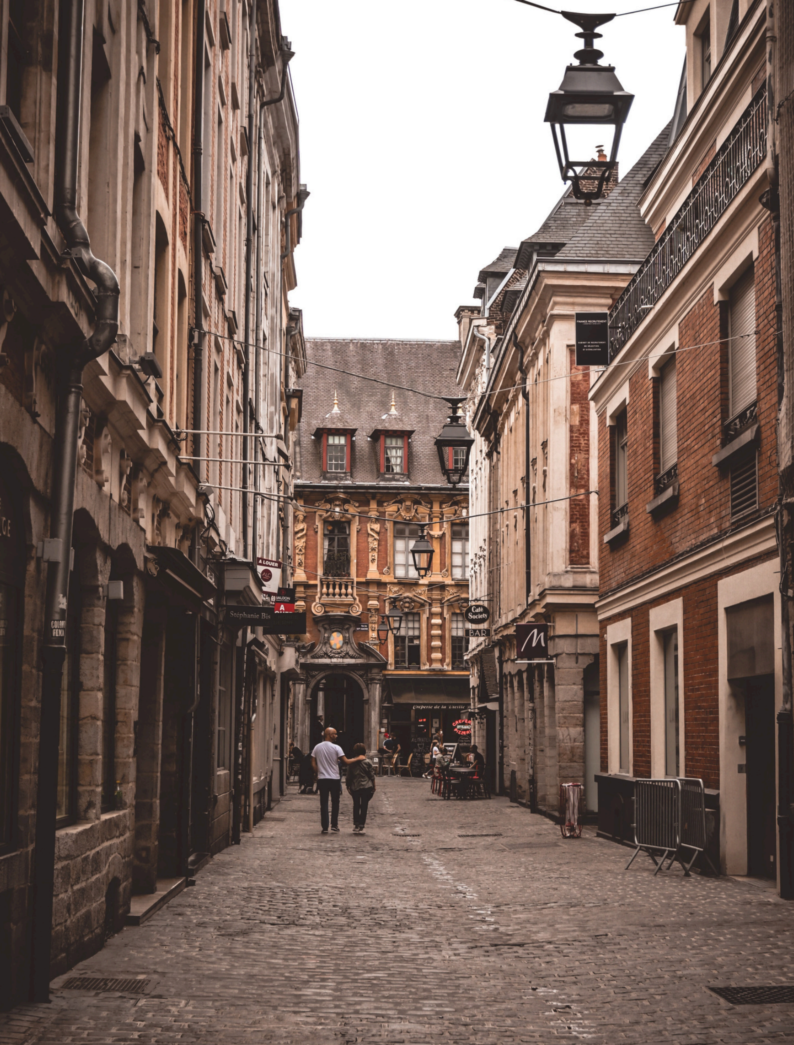
La vielle ville